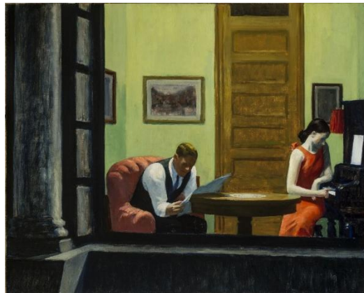
Room in New York (1932), de Edward Hopper