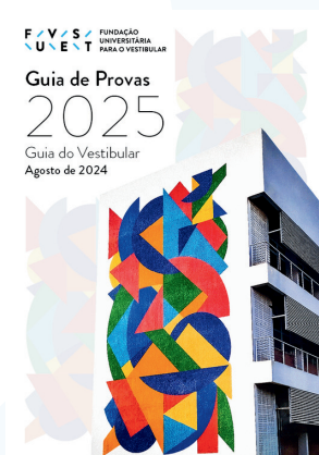
Guia de Provas