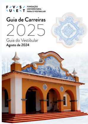
Guia de Carreiras