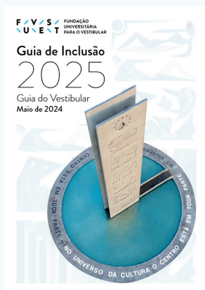
Guia de Inclusão

O Guia de Carreiras teve uma versão em PDF, além de uma edição especial chamada Guia Dinâmico de Carreiras e Cursos. Esta versão digital proporcionou uma experiência interativa, facilitando a busca por cursos relacionados a cada carreira, e oferecendo aos candidatos uma navegação mais eficiente e personalizada.